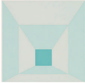
ジョセフ・アルバース 「Mitered Square」 28.6 × 28.6cm シルクスクリーン 1976年

「Regalo / Palma (レガーロ・パルマ) – 掌上の小さなプレゼント–」と題した恒例の展覧会を開催いたします。一年はいつも様々なことが過ぎていきます。今年もそんな色々なことに思いを巡らしながら、お世話になったあの方に、そして自分自身にアートを贈ろう、レガーロ・パルマはそんな展覧会です。