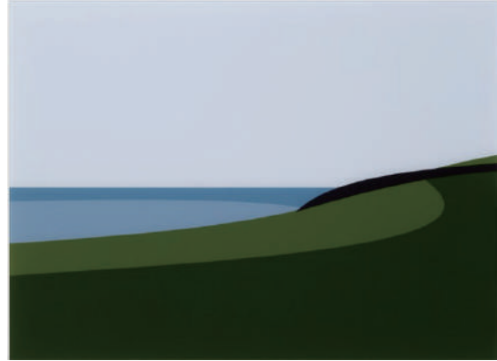
ジュリアン・オピー 「Lantivet Coast」 45 × 61.5cm デジタルプリント 2017年